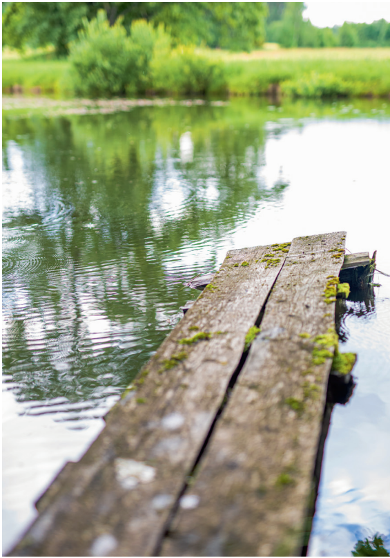
Ajahambast puretud purdelt on kogu perekond pärast leili tiiki sulpsanud.