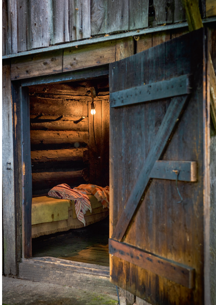
Suitsusaunas ei tasu vastu seina nõjatuda.

Väimees on küll kalamees, aga suitsusaun pole otseselt mõeldud kala suitsutamiseks. Selleks on Tarmol plaan soetada suitsuahi,