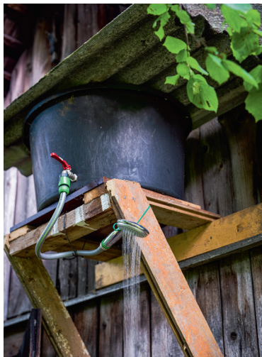
Helmuti meisterdatud lihtne dušš.

Varem köeti sauna selle põhiruumist, nüüd saab kütta eeskojast. Ka kerisel on vahetatud kivid ja osa neist paigutatud