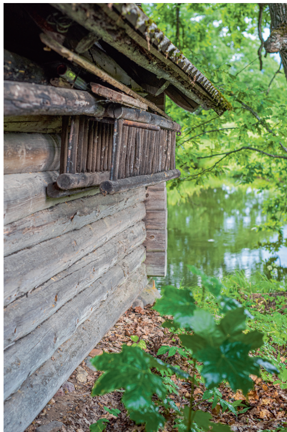
Tarmot kõnetavad vanade saunapalkide tekstuur ja muster.