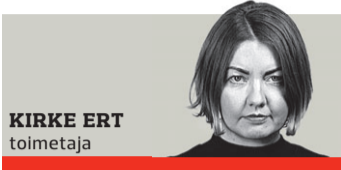
KIRKE ERT toimetaja

E esti Filharmoonia Kammerkoor (EFK) asub veebruaris seni pikimale, terve kuu kestvale kontserdi-turneele Ameerika Ühendriikides ja Kanadas, mille ettevalmistus on laias laastus kestnud pea kaks aastat ning mis toimub koostöös agentuuriga New World Classics (USA). Esimesest reist ookeani taha on möödas 27 aastat, viimastel aastatel satutakse sinna keskmiselt kord hooajal.